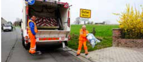
Inleefdag bij ILVA p. 2